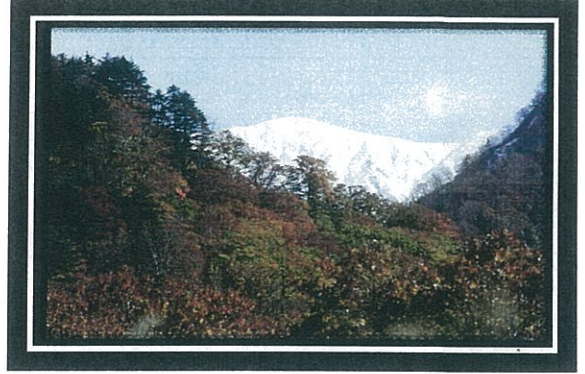
奥胎内の紅葉と雪を纏った飯豊連峰

滝の周りで紅葉を見るとき のご注意 この付近は道幅が狭いため、 駐車はできません。胎内第1 発電所付近に車を停めて、歩 いてお楽しみください。