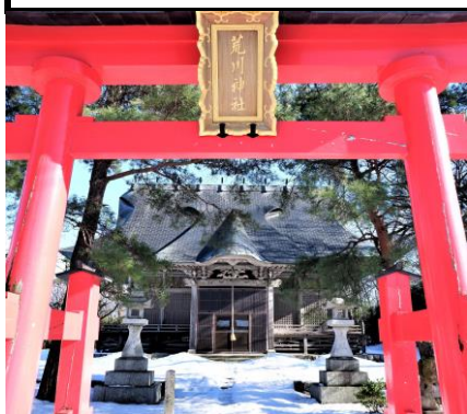
桃崎浜の荒川神社