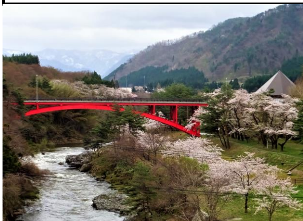
水天宮から観る樽ヶ橋