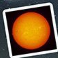
太陽望遠鏡で見た太陽!

県内最大級の60cm反射望遠鏡! 観望会の夜は、この望遠鏡で 色々な天体を見てみよう!