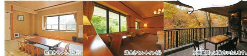
和室(バス・トイレ付)